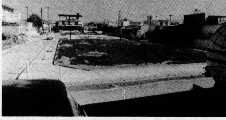
Η πλατεία Γ. Πυρουνάκη στο Καλυμπάκι

Η πλατεία αυτή θα επεκταθεί περισσότερο, μόλις τελειώσει η ένταξη της περιοχής στο σχέδιο.