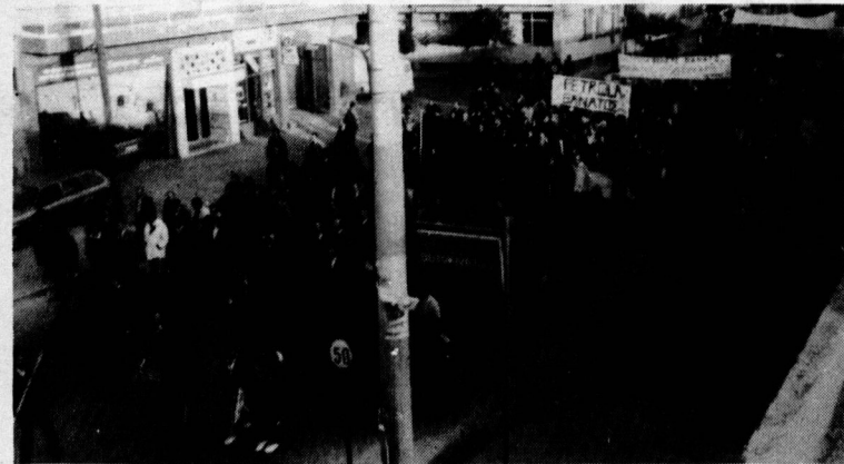
Σημείο από την εντυπωσιακή σε παλμό και όγκο πορεία

Σας προσκαλούμε να γίνεται μέλη της δhlώνοντας τη συμμετοχή σας στο γραφείο της Κοινωνικής Υπηρεσίας από τις 10 μέχρι τις 12 το μεσημέρι.