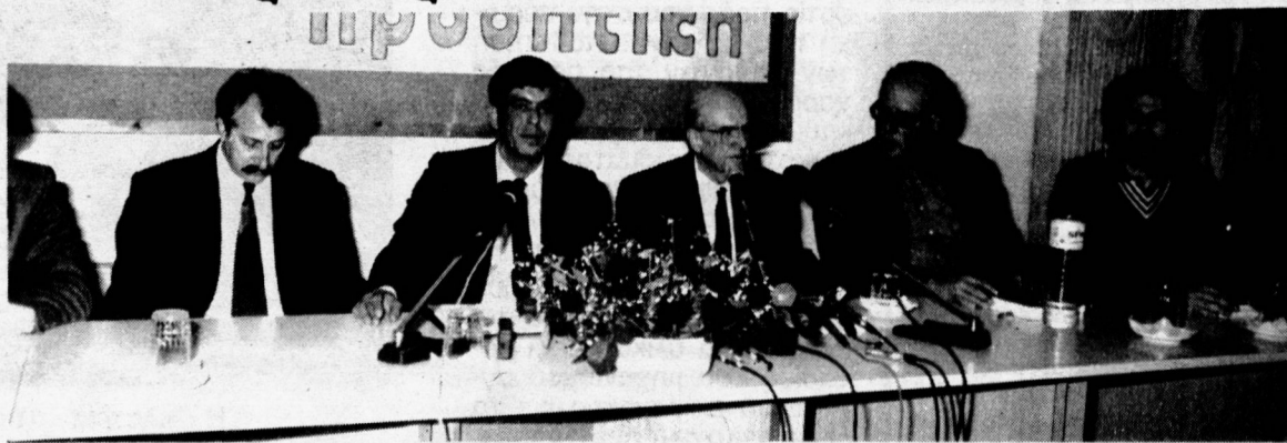
Στην εικόνα από τη σύσκεψη για τα προβλήματα της Ελευσίνας. Από αριστερά: Ο Πρόεδρος του Εργατικού Κέντρου Π. Λαζάρου, ο δήμαρχος Π. Παπαπέτρου, ο Πρόεδρος του ΠΑΣΟΚ Α. Παπανδρέου, και τα στελέχη του κινήματος Θ. Πάγκαλος και Κ. Λαλιώτης.

κ. Παπαπέτρου, κ. Λαζάρου, δήμαρχοι, εκπρόσωποι των εργαζομένων, φίλες και φίλοι της Ελευσίνας. Πραγματικά μέσα σε λίγα λεπτά, σε λίγη ώρα, ο Δήμαρχος έδωσε μια παραστατικότητα εικόνα, του τι ήταν και είναι το Θ.Π. και η Ελευσίνα, κ. ο κ. Λαζάρου επίσης προσδιόρισε το δημιουργικό ρόλο που καλείται να παίξει η τάξη των εργαζομένων, στην πορεία αντιμετώπισης των μεγάλων προκλήσεων της εποχής. Πράγματι αυτά που ελέγχθηκαν σήμερα ήδη αποτελούν το 3ο τεύχος που δεν είναι ακόμη τυπωμένο, το τεύχος που αφορά την αύριο για το Θ.Π. για την πόλη της Ελευσίνας. Είναι πράγματι η περιοχή αυτή, είναι πρότυπο, ένα παράδειγμα, όπως ήδη υπήρξε. Το τι σημαίνει άναρχη ανάπτυξη, η ανάπτυξη που στηρίζεται μονάχα σε κριτήρια του ιδιωτικού κέρδους. Γιατί είναι πάρα πολύ απλό το πράγμα. Όταν δεν υπάρχει καμμία κοινωνική παρέμβαση είτε αυτή είναι από την πολιτεία είτε από άλλους κοινωνικούς φορείς. Ο επιχειρηματίας αναγκαστικά βλέπει μονάχα τα λογιστικά του βιβλία. Σε εκείνα τα βιβλία οι αρνητικές παρενέργειες στο περιβάλλον δεν εμφανίζονται, δεν είναι τμήμα του κόστους της επένδυσης. Όταν μιλάμε για το ρόλο της αγοράς τον οποίο