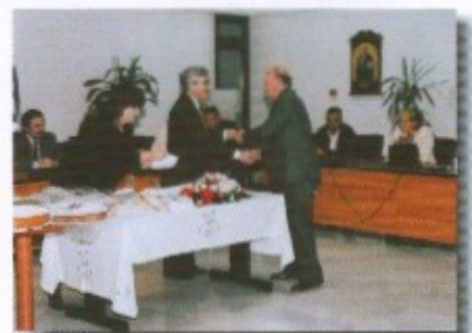
Στιγμιότυπο από την κοπή της πίτας των εθελοντών της Κοινωνικής Υπηρεσίας