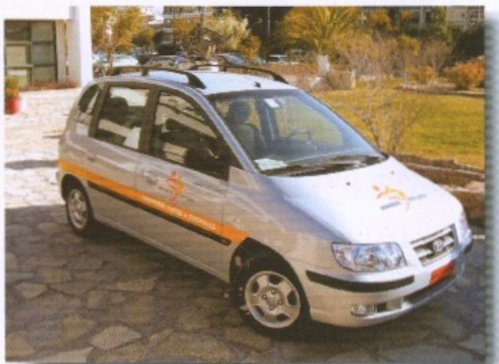
Το πολυμορφικό αυτοκίνητο, νέο απόκτημα του Δήμου μας, για τις ανάγκες του προγράμματος ΒΟΗΘΕΙΑ ΣΤΟ ΣΠΙΤΙ

Τα προγράμματα στελεχώνονται από Κοινωνικούς λειτουργούς, Νοσηλεύτριες, Οικογενειακές βοηθούς.