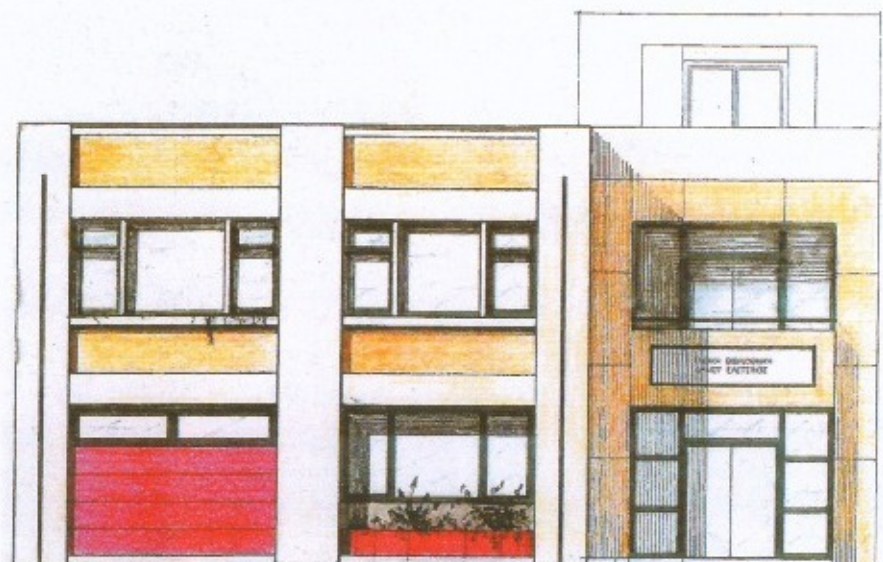
ΟΨΗ ΕΠΙ ΤΗΣ ΟΔΟΥ ΚΟΝΤΟΤΑΗ

Ξεκίνησαν οι εργασίες για την κατασκευή του νέου κτιρίου της παιδικής βιβλιοθήκης και σε λίγο καιρό οι μικροί μας φίλοι θα συναντώνται ξανά στο γνώριμο σημείο, αλλά σε ανανεωμένο χώρο.