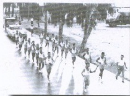
Λαμπαδηδρομία στην Ελευσίνα 1960 για την Ολυμπιάδα της Ρώμης

Για 30 λεπτά θα παραμείνει «αναμμένη» σε βωμό και θα συνεχίσει το «ταξίδι» της από τις οδούς Δήμητρος, Εθνικής Αντιστάσεως, Ελευθερίου Βενιζέλου, μέχρι τον κόμβο του Παράδεισου, διασχίζοντας ένα μεγάλο κομμάτι της πόλης μας.