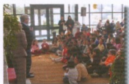
Πασχαλινή εκδήλωση για τα παιδιά Στο ισόγειο του Δημαρχείου 6/4/04