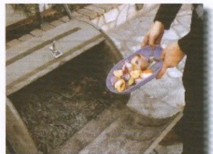
Στη φωτογραφία Κομποστοποιήτης σε μπαλκόνι ή ταράτσα

Στόχος η διάδοση του εθελοντισμού σε δράσεις προστασίας του περιβάλλοντος και η επέκταση του προγράμματος σε όλο το Δήμο.