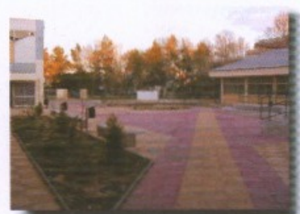
Η αυλή των 2ου και 4ου Γυμνασίων ΠΙΝ και ΜΕΤΑ την ανακατασκευή