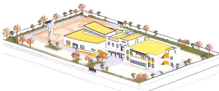
Η μακέτα του κτιριακού συγκροτήματος, στην κάτω φωτογραφία

Σε οικόπεδο έκτασης 4 στρεμμάτων, πίσω από το 9ο Δημοτικό Σχολείο, αρχίζει η ανέγερση του Ειδικού Σχολείου. Χρειάστηκε επίμονη προσπάθεια της Δημοτικής Αρχής για να ξεπεραστούν δεκάδες γραφειοκρατικά εμπόδια.