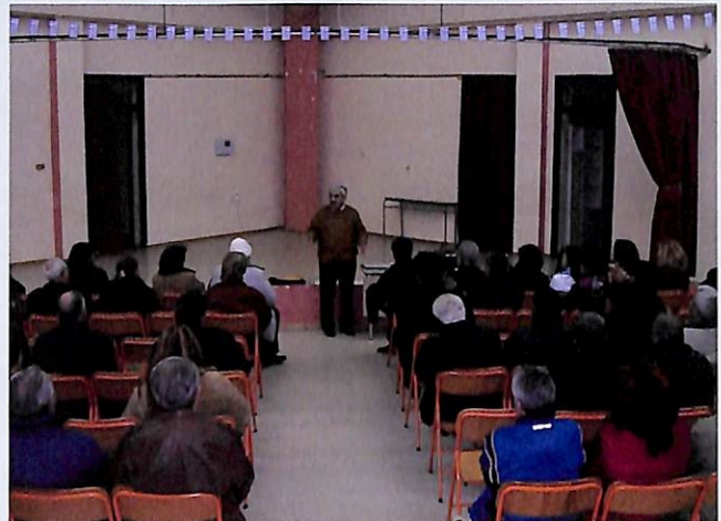
Συγκέντρωση στο 7ο Δημοτικό Σχολείο (9 φεβρουαρίου 2005)