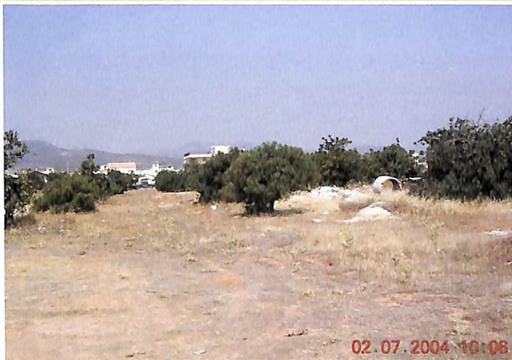
Στην πάνω φωτογραφία φαίνεται μέρος του οικοπέδου όπου θα κατασκευαστεί το σχολείο.