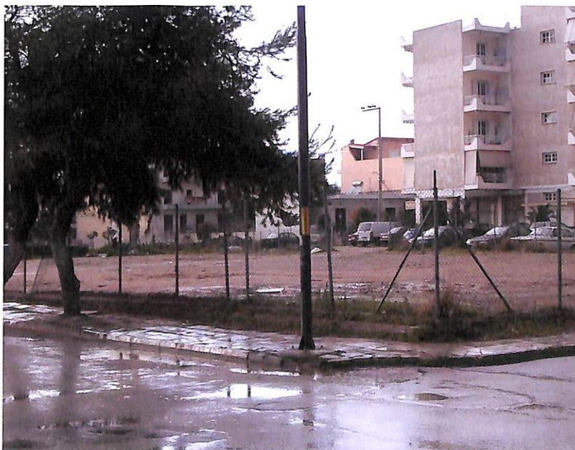
Το οικοπέδο δίπλα στην Πλατεία Λαού

* Αναμένεται η ολοκλήρωση της υπόσχεσης του Υπουργείου Εθνικής Άμυνας, για παραχώρηση χώρου 40 στρεμμάτων από την έκταση του Αεροδρομίου.