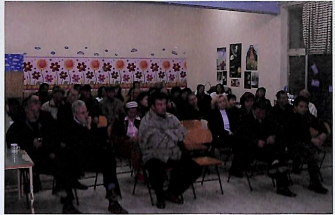
Στιγμιότυπο από το 4ο Δημοτικό Σχολείο (24 Νοεμβρίου 2004)

Όλες οι συνελεύσεις θα γίνονται στις 6.30 το απόγευμα.