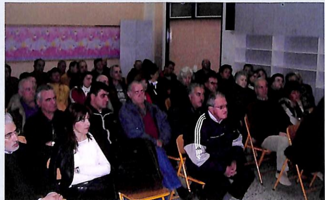
Συγκέντρωση στο 8ο Δημοτικό Σχολείο (10 φεβρουαρίου 2005)