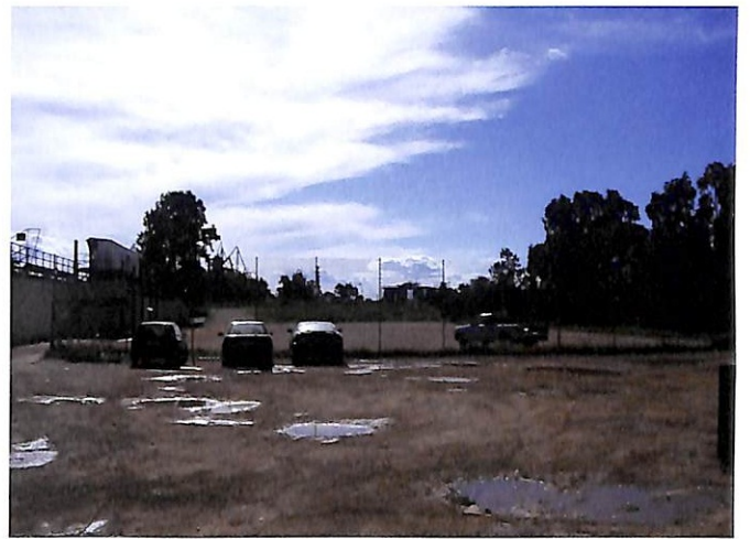
Το οικοπέδο δίπλα στο γήπεδο του Πανελευσινιακού