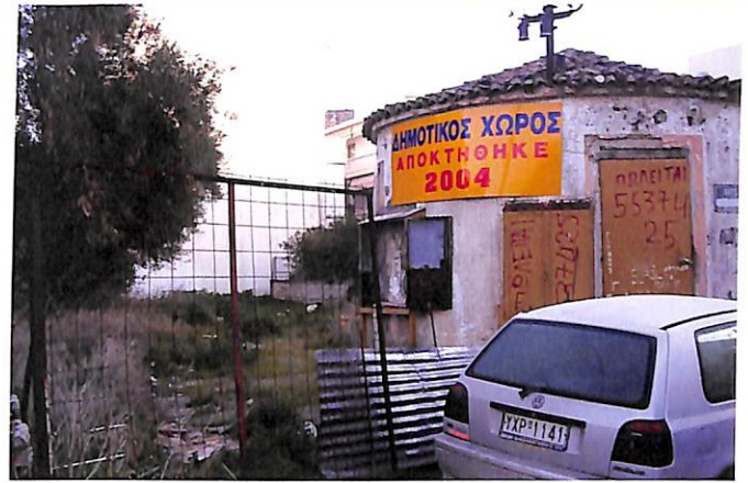
Το οικοπέδο στο Ο.Τ. 291 (στο τέλος της οδού Δήμητρος)

* Μέσα στους προσεχείς μήνες αναμένεται να ολοκληρωθεί η απόκτηση των 2 οικοπέδων ιδιοκτησίας Εθνικής Τράπεζας. Το ένα βρίσκεται επί της οδού Πίνδου σε επαφή με την πλατεία Λαού και το άλλο απέναντι από την πλατεία Νεολαίας.