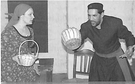
Φωτογραφίες από πρόβες