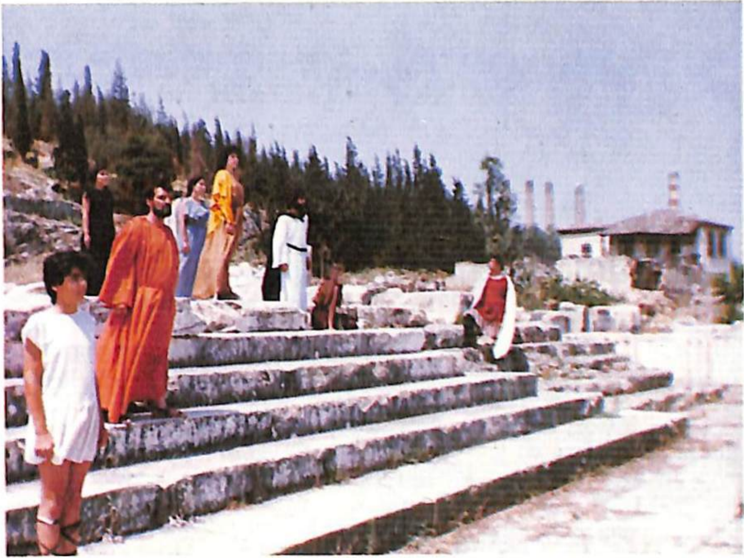
Από τις πρόβες της Τραγωδίας του Αισχύλου «Αγαμέμνων» που παρουσιάζει το Δημοτικό Θέατρο Ελευσίνας.