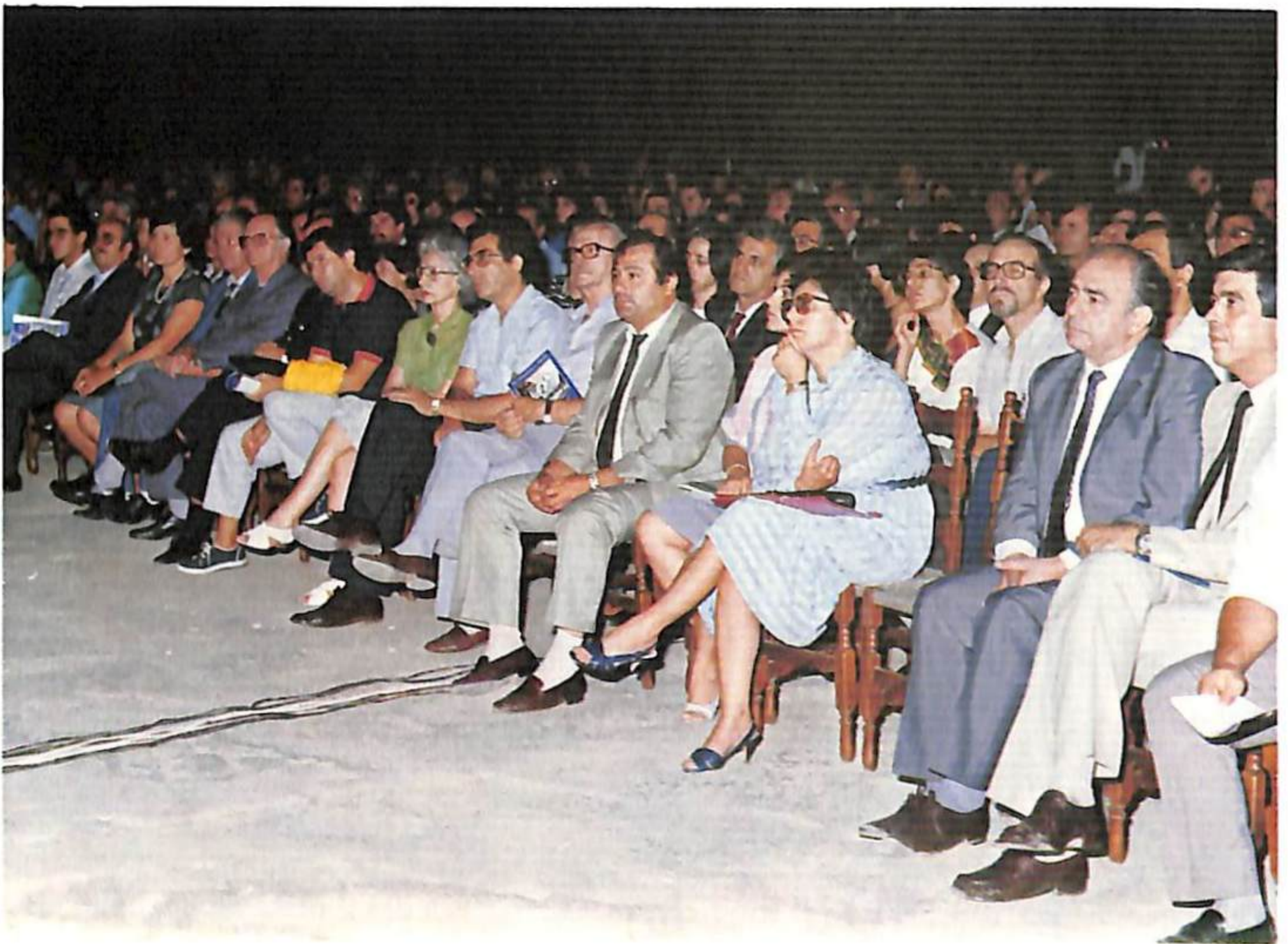
Από την παρακολούθηση της Κωμωδίας του Αριστοφάνη «Νεφέλες» που παρουσίασε ο Εταιρικός Θίασος ΟΕΘ/ΣΕΗ «Αιμίλιος Βεάκης»