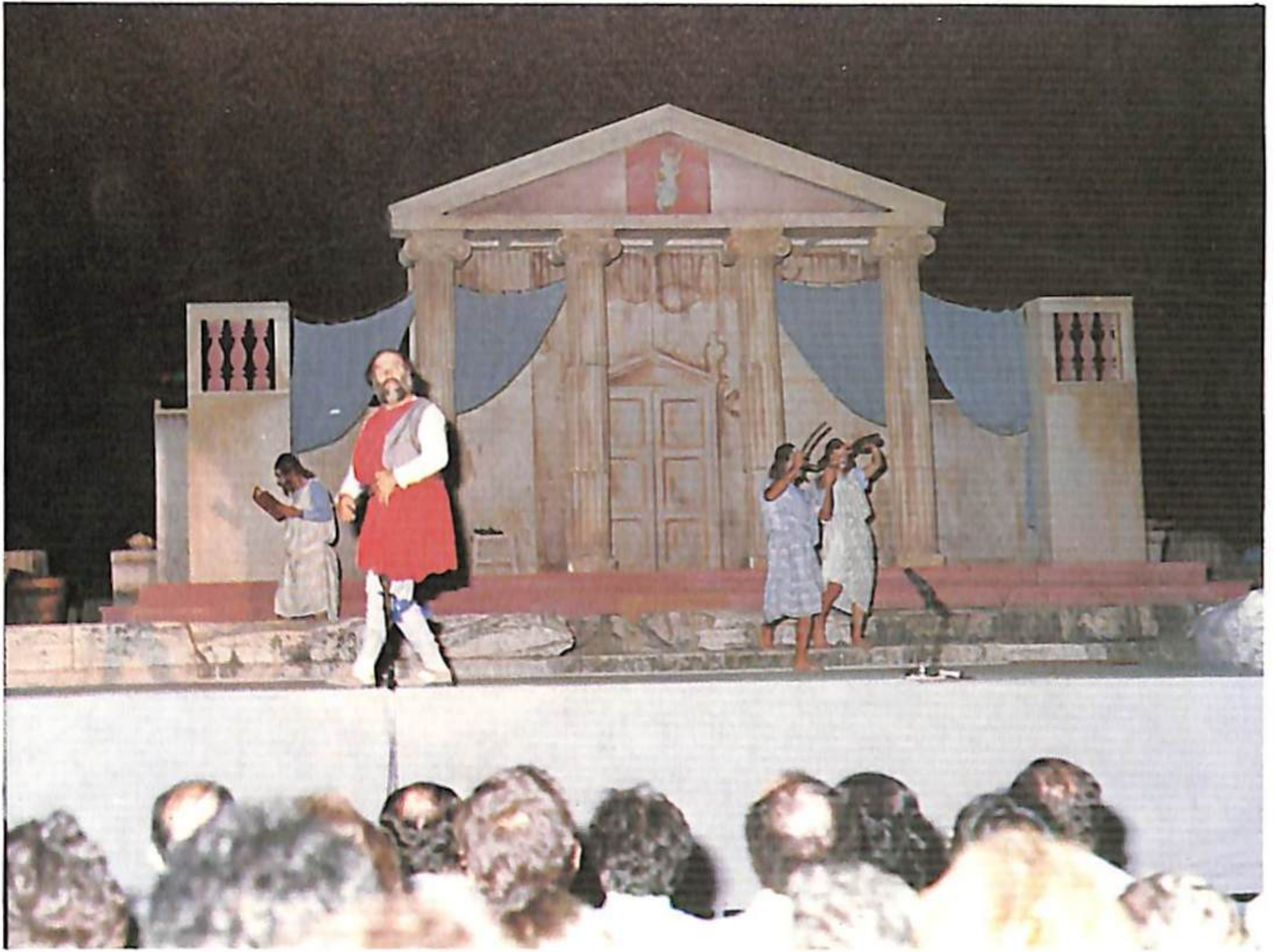
Από την παράσταση του Αριστοφάνη «Νεφέλες» που παρουσίασε ο Εταιρικός Θίασος ΟΕΘ/ΣΕΗ «Αιμίλιος Βεάκης» την 1 Σεπτέμβρη 1985.