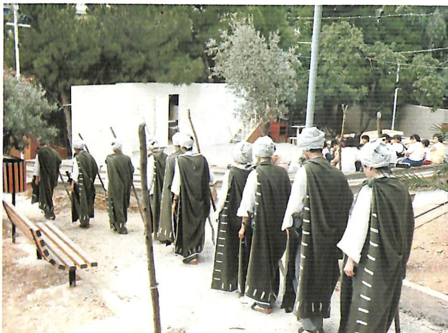
Από τις πρόβες της Τραγωδίας του Αισχύλου «Αγαμέμνων» που παρουσιάζει το Δημοτικό Θέατρο Ελευσίνας.

Προς το τέλος του δράματος ο Χορός, δύο φορές, επισείει στο δειλό και χυδαίο σφετεριστή της εξουσίας Αίγισθο (και στην Κλυταιμίστρα) την απειλή από τον Ορέστη, γιό του Αγαμέμνονα.