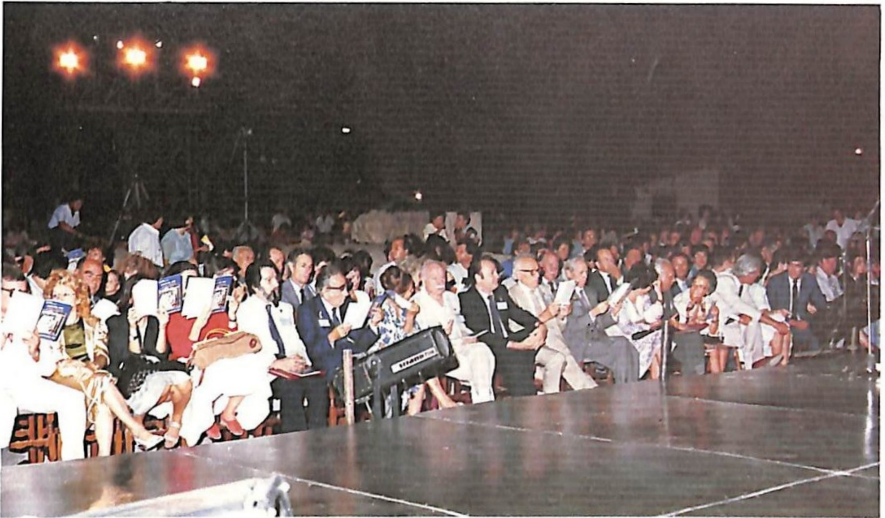
Σύνεδροι και λαός παρακολουθούν την τραγωδία του Αισχύλου «Προμηθέας Δεσμώτης» που παρουσίασε το Θέατρο Τέχνης.