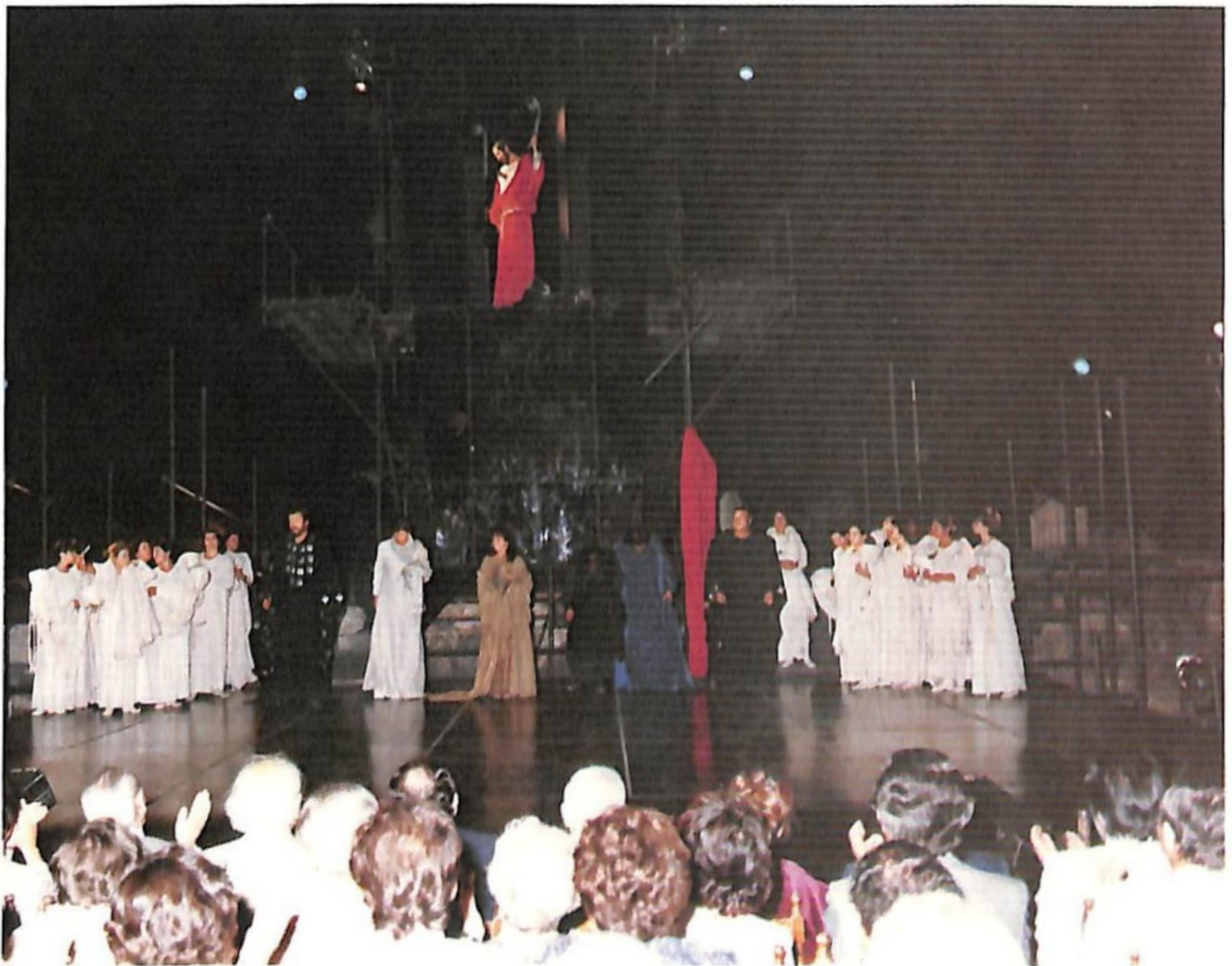
Από την Τραγωδία του Αισχύλου «Προμηθέας Δεσμώτης» που παρουσίασε το Θέατρο Τέχνης στα ΑΙΣΧΥΛΕΙΑ 1985.