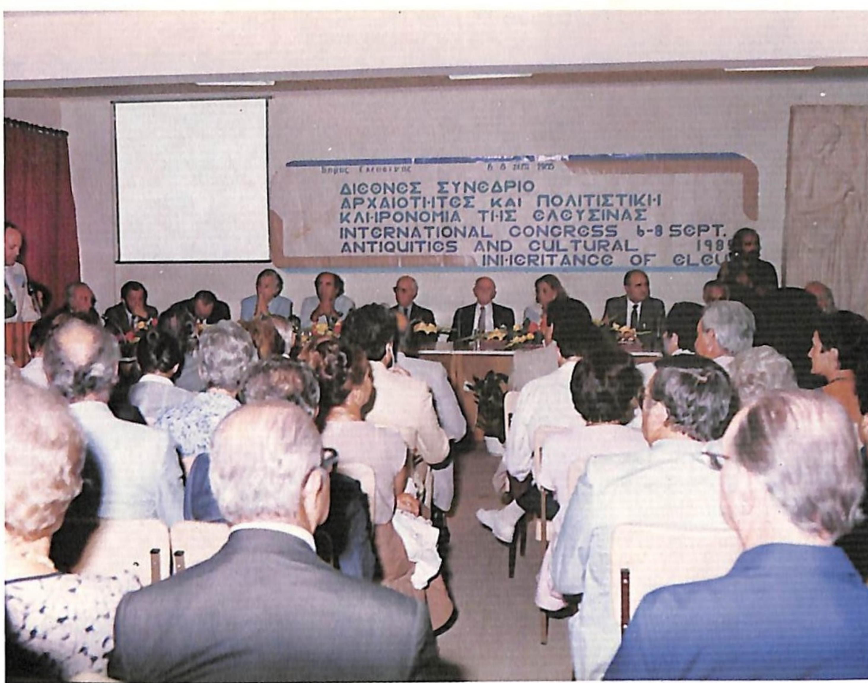
Το Προεδρείο και Σύεδροι του Διεθνούς Συνεδρίου που πραγματοποιήθηκε τον Σεπτέμβρη 1985