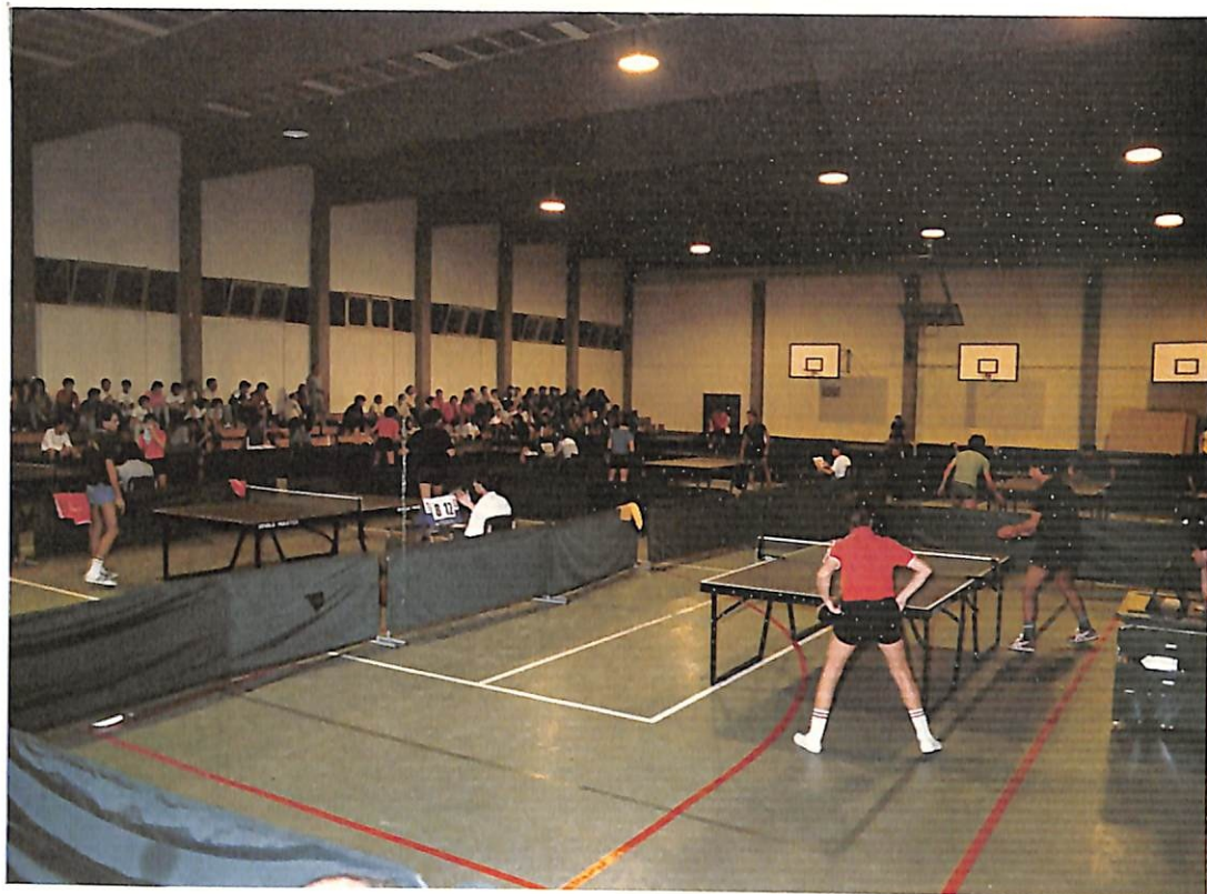
Από τις αθλητικές εκδηλώσεις στα πλαίσια των ΑΙΣΧΥΛΕΙΩΝ 1985