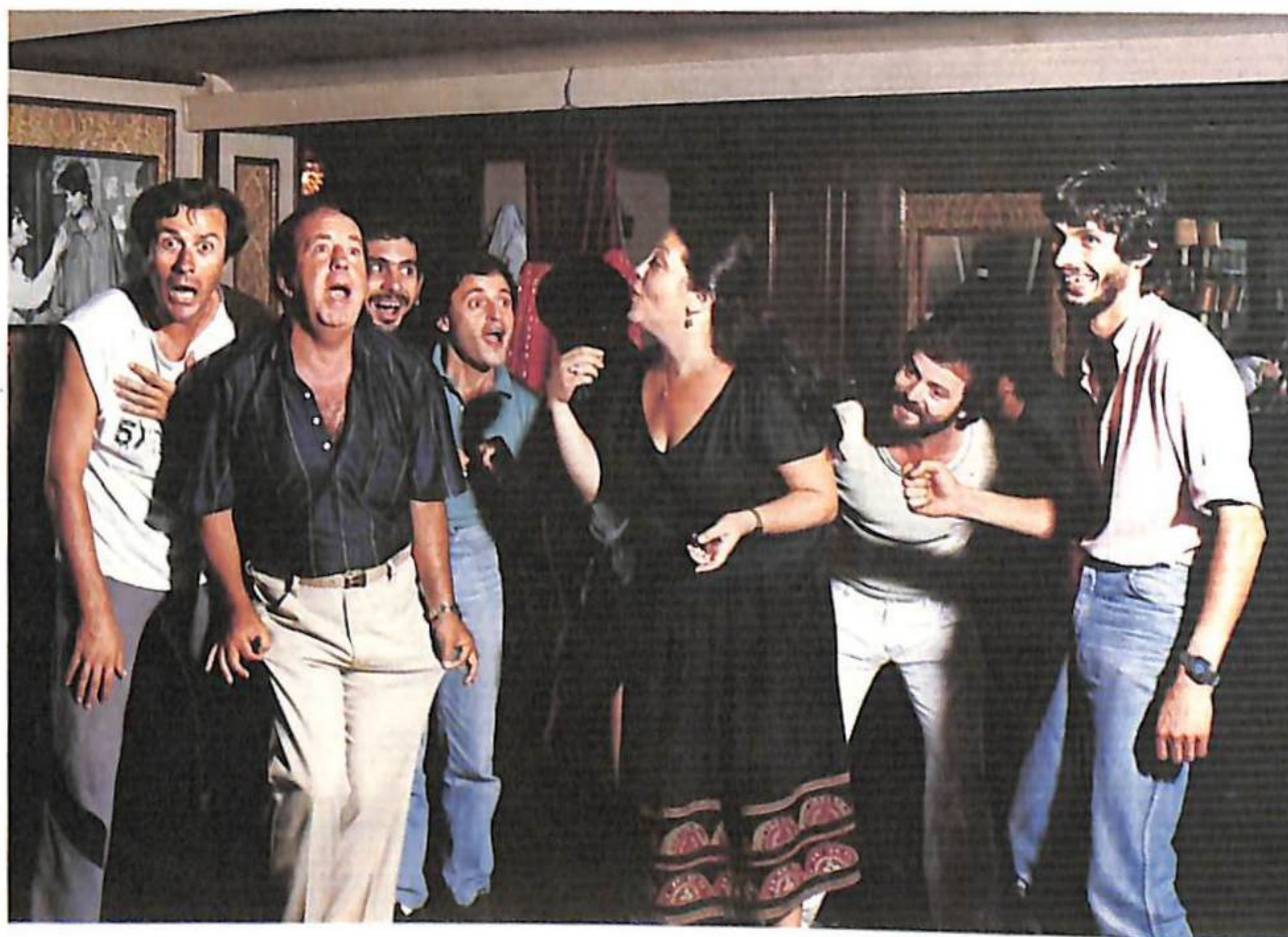
«Πλούτος» Από την πρόβα.

Σκηνοθεσία: Κώστας Μπάκας Σκηνογραφία-κουστούμια: Σίμος Καραφύλλης Μουσική: Γιώργος Τσαγγάρης Χορογραφία: Αγγέλα Καζακίδου.