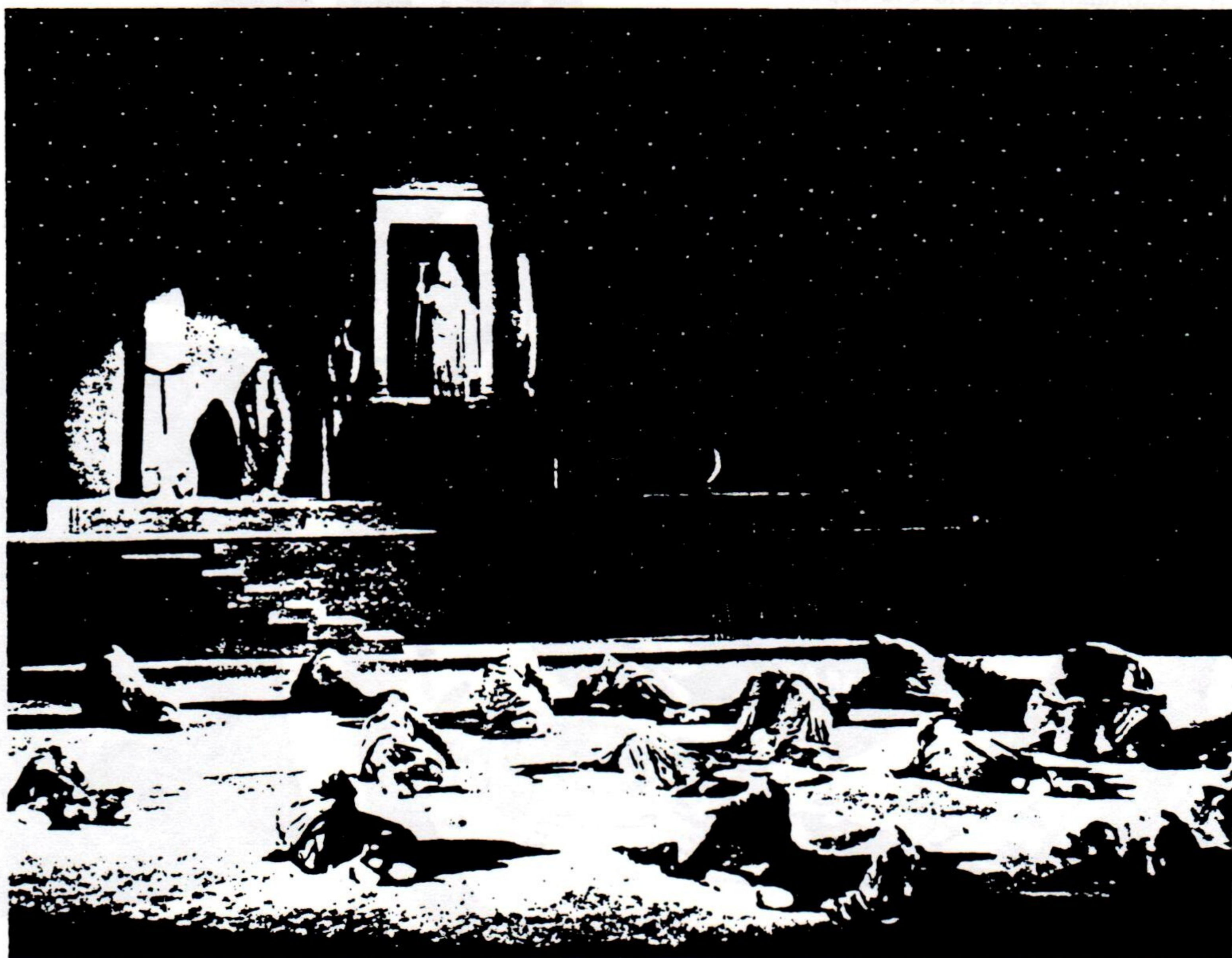
ΑΠΟ ΤΗ ΔΟΚΙΜΗ ΤΟΥ ΕΡΓΟΥ «ΠΕΡΣΕΣ»