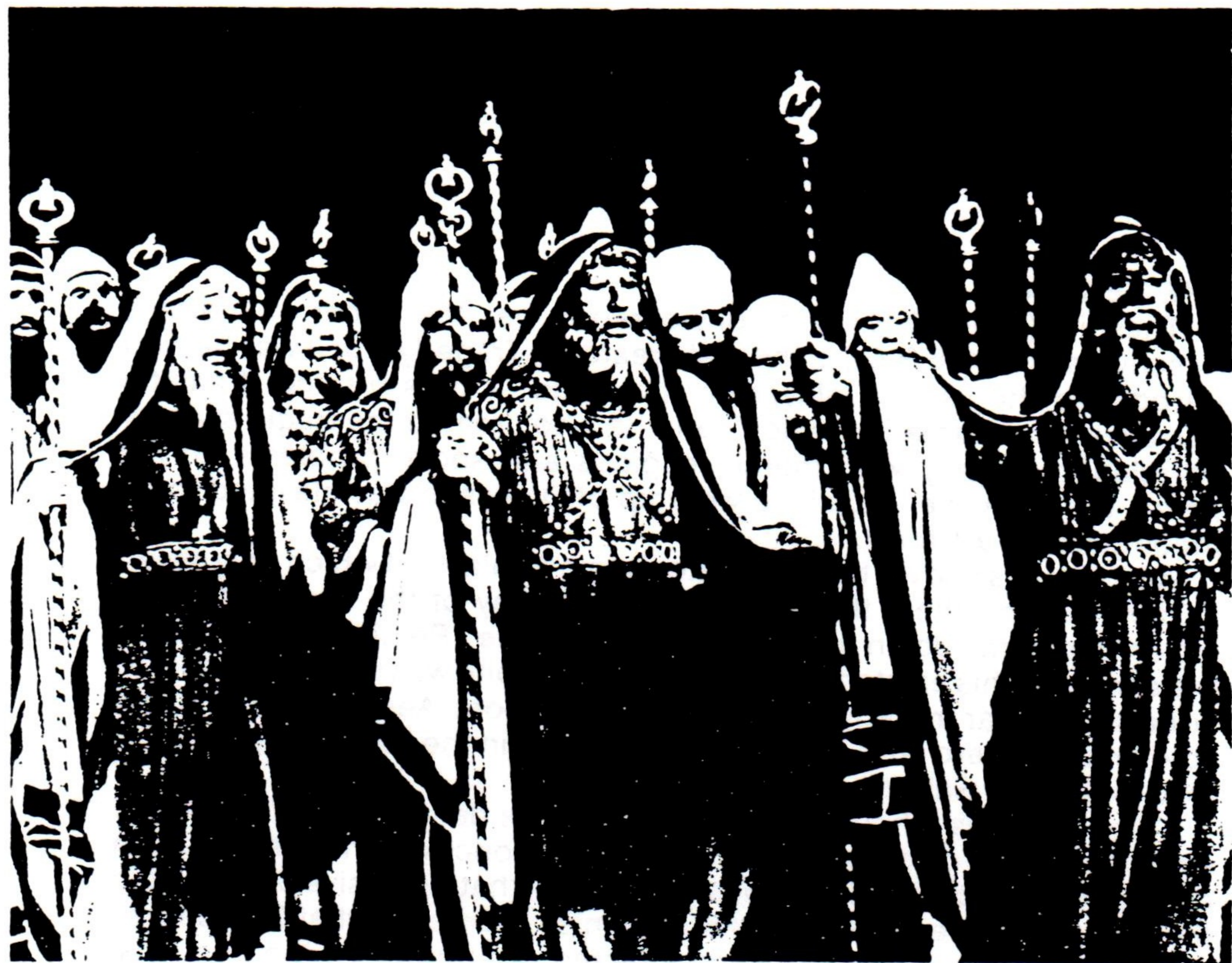
ΑΠΟ ΤΗ ΔΟΚΙΜΗ ΤΟΥ ΕΡΓΟΥ «ΠΕΡΣΕΣ»