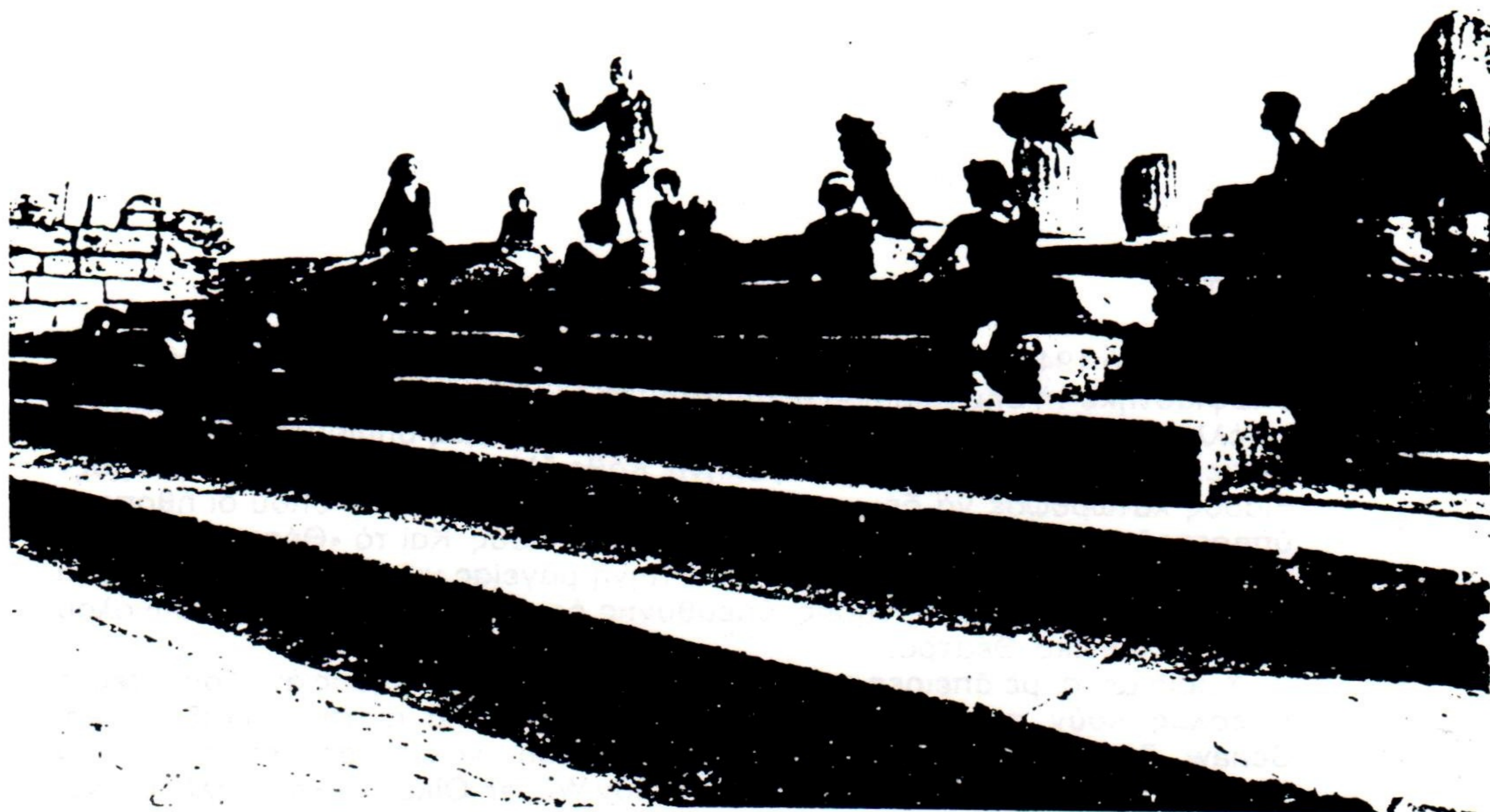
ΑΠΟ ΤΗ ΔΟΚΙΜΗ ΤΟΥ ΕΡΓΟΥ «ΠΡΟΜΗΘΕΑΣ ΔΕΣΜΩΤΗΣ» ΕΙΣ ΤΟΝ ΧΩΡΟΝ ΤΩΝ ΜΕΓΑΛΩΝ ΠΡΟΠΥΛΑΙΩΝ ΤΗΣ ΕΛΕΥΣΙΝΟΣ