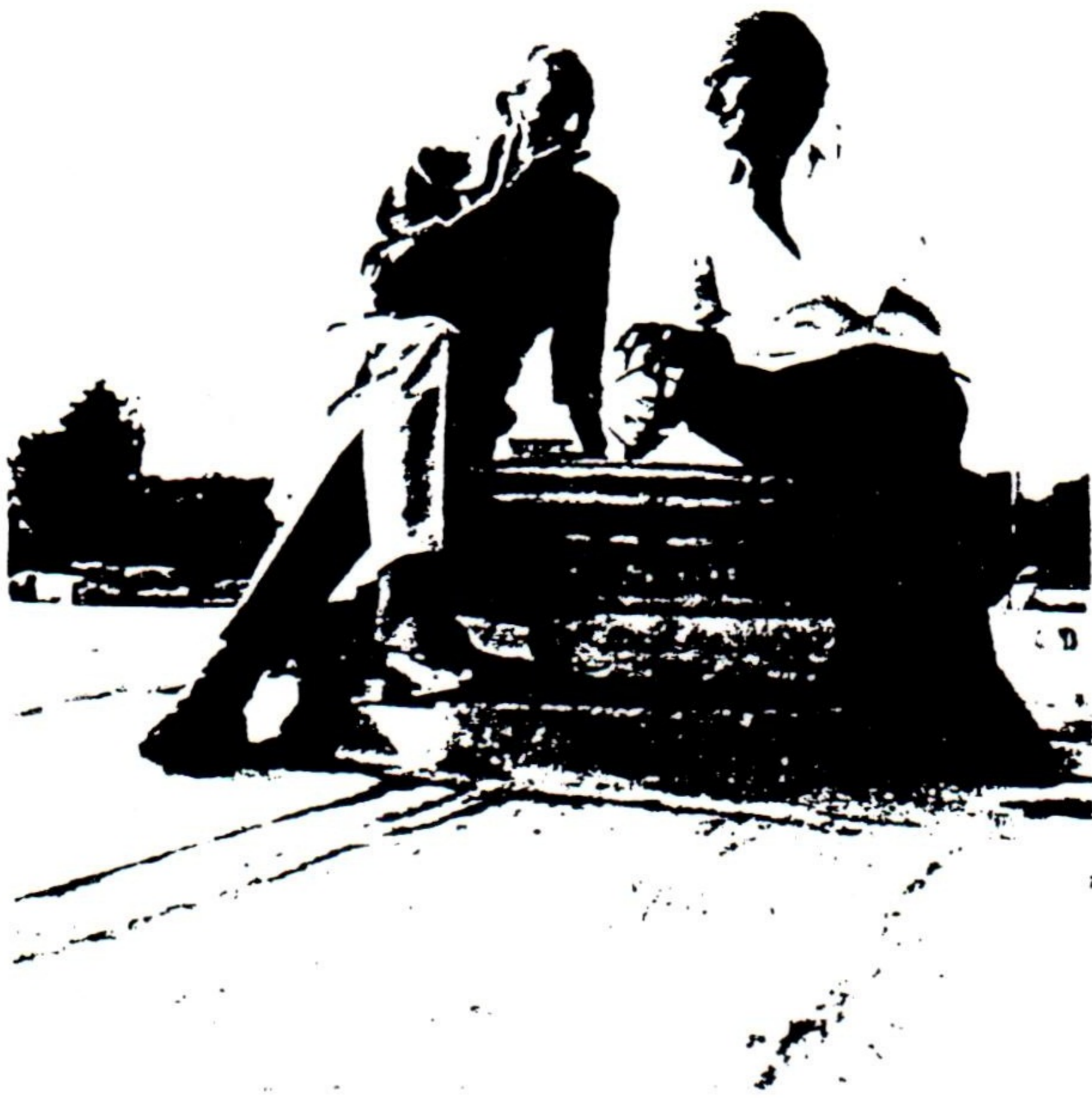
ΣΟΛΟΜΟΣ ΚΑΙ ΚΑΤΡΑΚΗΣ