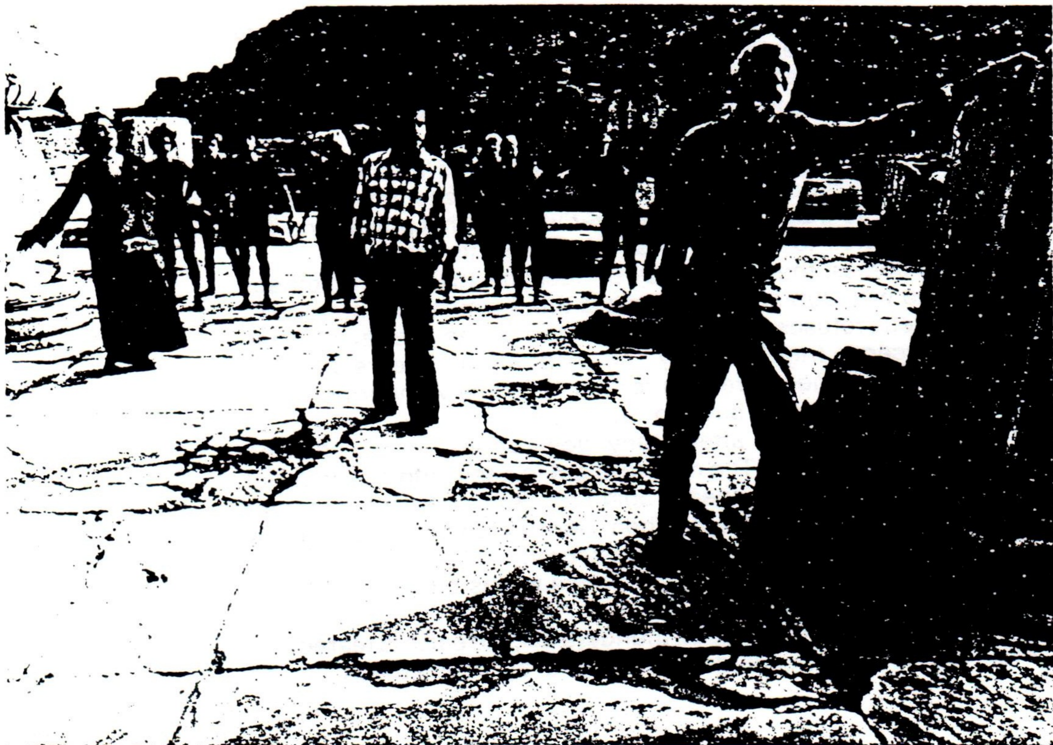
ΑΠΟ ΤΗ ΔΟΚΙΜΗ ΤΟΥ ΕΡΓΟΥ «ΠΡΟΜΗΘΕΑΣ ΔΕΣΜΩΤΗΣ» ΕΙΣ ΤΟΝ ΧΩΡΟΝ ΤΩΝ ΜΕΓΑΛΩΝ ΠΡΟΠΥΛΑΙΩΝ ΤΗΣ ΕΛΕΥΣΙΝΟΣ