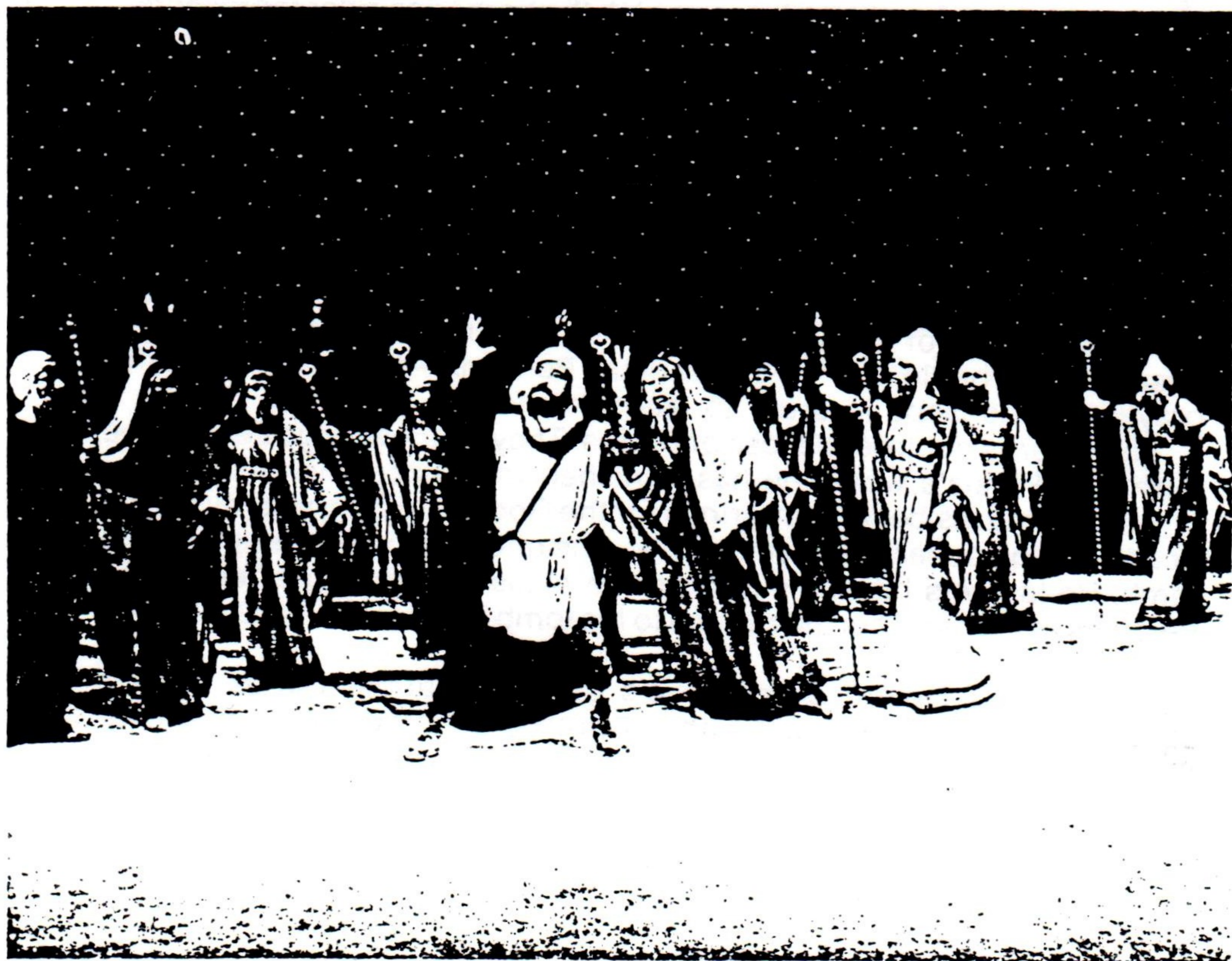
ΑΠΟ ΤΗ ΔΟΚΙΜΗ ΤΟΥ ΕΡΓΟΥ «ΠΕΡΣΕΣ»