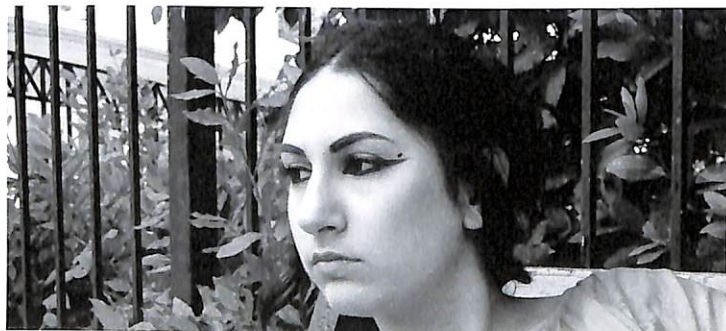
Η φωτογράφιση έγινε τον Ιούνιο του 2011 από την Γωγώ Μπαλασοπούλου, μαθήτρια της Α' Λυκείου, σε διάφορα σημεία της Ελευσίνας.

Κείμενο - Σκηνοθεσία: Ευάγγελος Αβραάμ Ερμηνεία: Όλγα Βλάχου