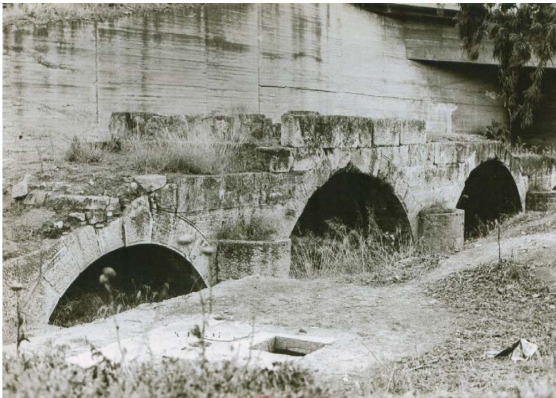
Η Ρωμαϊκή γέφυρα απ' όπου περνούσε ο Ελευσινιακός Κηφισός και από πάνω η Ιερά Οδός.

- Τι είναι τούτο ; Δε φαίνεται αρχαίο. Γιατί το έφτιαξαν εδώ ;