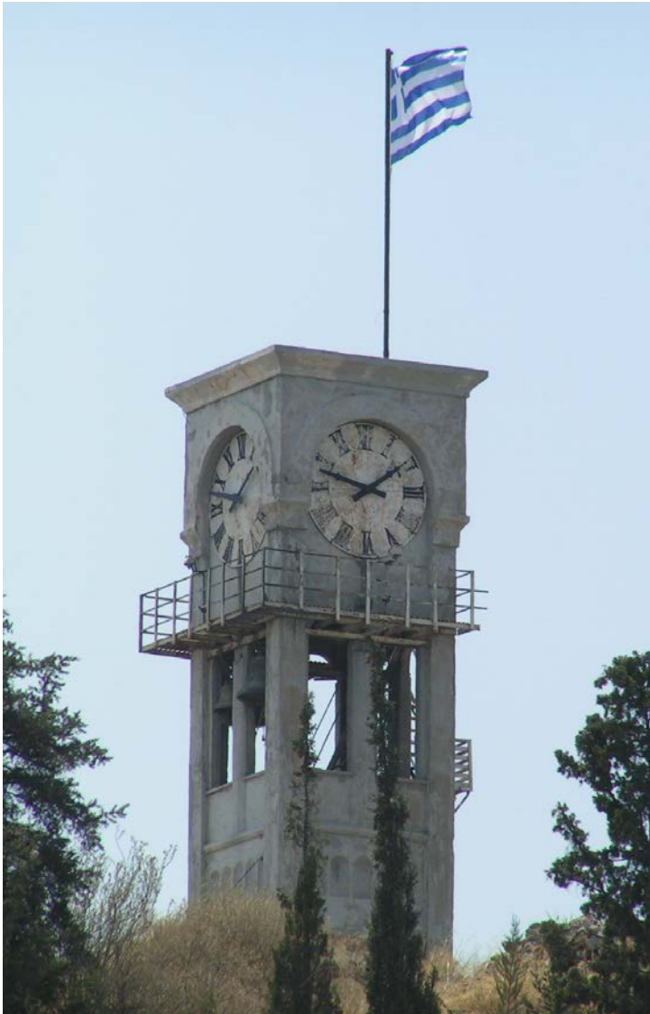
Το ρολόι της Ελευσίνας έγινε πλέον σύμβολο.

Να πούμε λοιπόν ότι άρχισε να λειτουργεί στα 1926, ότι κινείται με τη βαρύτητα, ότι έχει τρεις καμπάνες που χτυπούν κάθε τέταρτο και τις ώρες και ότι θεωρείται από τα σπάνια μηχανήματα. Το μηχανήμα είναι δώρο μιας οργάνωσης