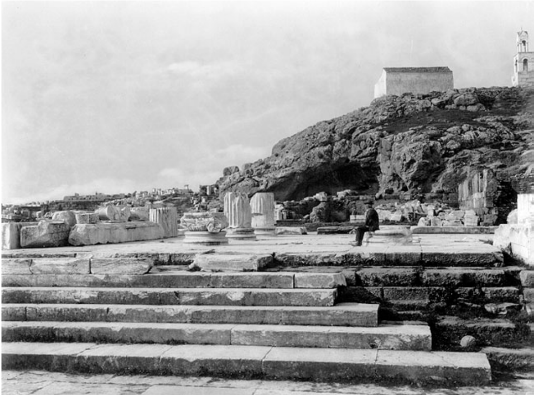
Είσοδος των μεγάλων προπυλαίων του ιερού χιλιάδες μύστες ανέβηκαν τούτες τις σκάλες "κεκαθαρμένοι τη καρδιά" για να κοινωνήσουν τα άχραντα μυστήρια του αιωνίου φωτός.

Μια ιστορική πηγή από πρώτο χέρι, σαν και τούτο το κείμενο, μας δίνει έγκυρες πληροφορίες και γεγονότα που κινδυνεύει να τα πάρει μαζί του ο χρόνος σε πλήρη εξαφάνιση. Περιέχει πραγματικά στοιχεία γι αυτό και είναι πολύτιμο ιστορικό υλικό για τους νέους μας, κυρίως, στους οποίους το αφιερώνω.