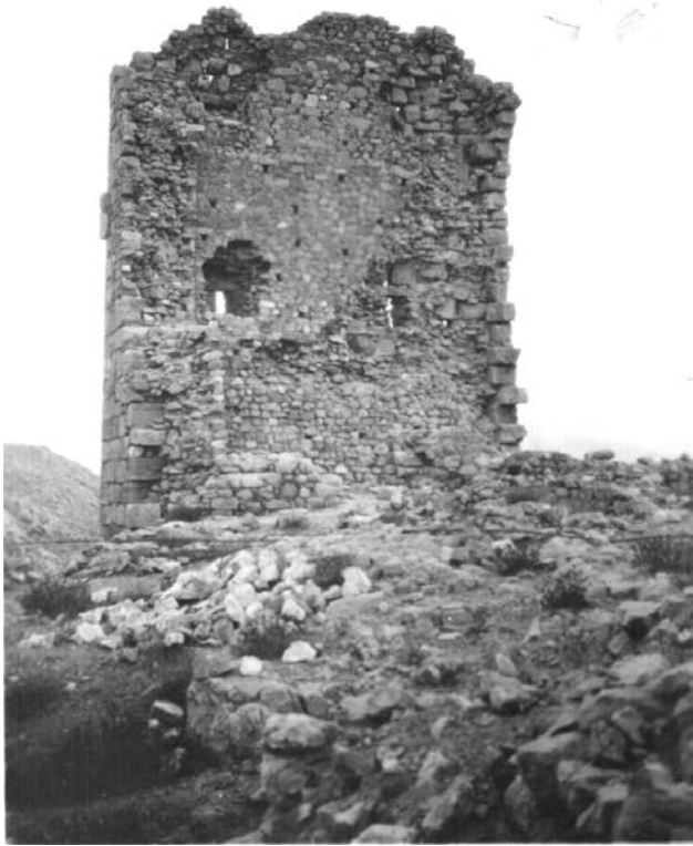
Σ' έφαγαν και σένα μεγαλοπρεπή μάρτυρα μιας ιστορικής εποχής. Κι έμεινα εγώ στα 16 μου τότε να πάρω την όψη σου. Μείνε τουλάχιστον έστω όπως σε φωτογραφία.

Ενετοί κυριαρχούσαν στη Μεσόγειο και στα σημαντικότερα λιμάνια. Για την ασφάλειά τους οικοδομούσαν κάστρα σε επίκαιρα σημεία για να ελέγχουν τη θάλασσα.