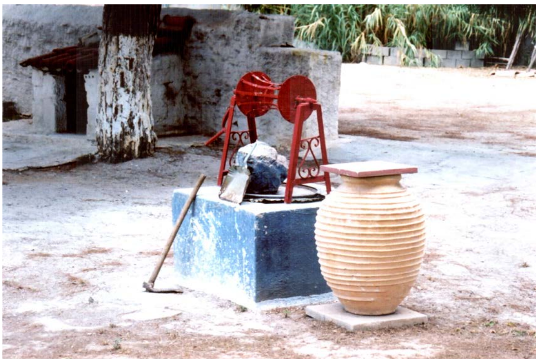
Δuo είδη νερό είχαμε στην αυλή. Το πόσιμο το διατηρούσαμε σε πήλινα κιούπια σκεπασμένα. Παρακολουθούσε ο νερουλάς το νερό και έριχνε

Τα γνώρισα τότε που λειτουργούσαν. Είδα διψασμένους να σηκώνουν τον κουβά και να πίνουν νερό. Αυτό όμως που μου άρεσε περισσότερο ήταν όταν έβλεπα τα ζώα να πίνουν νερό να ξεδιψάσουν... Μπορώ να σας πω ότι αισθανόμουν την ευτυχία τους στο πρόσωπό τους.